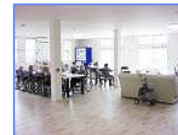
ホール(食堂・機能訓練室) 陽当りが良く、広々とした空間でお過ごしいただけます。