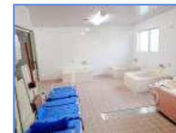
浴室 個浴・機械浴をご用意し、お風呂専用の車椅子もございます。