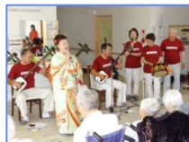
年中行事・慰問 季節や時期に応じた各種の催し物、慰問を楽しんでいただいております。

在宅で介護をされているご家族の身体的・精神的負担の軽減。 また、ご家族が病气や冠婚葬祭、仕事、旅行などで一時的に介護ができない場合などに、ご家族に代わって施設で介護を提供する短期入所サービスです。 介護を受ける高齢者の方に短期入所していただき、お食事や入浴といった日常生活全般の介護など提供いたします。