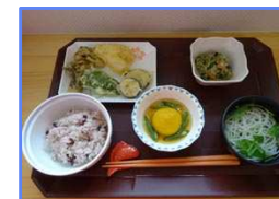
お食事 消化に良く、栄養を考慮した手作り、つくりたてのお食事です。